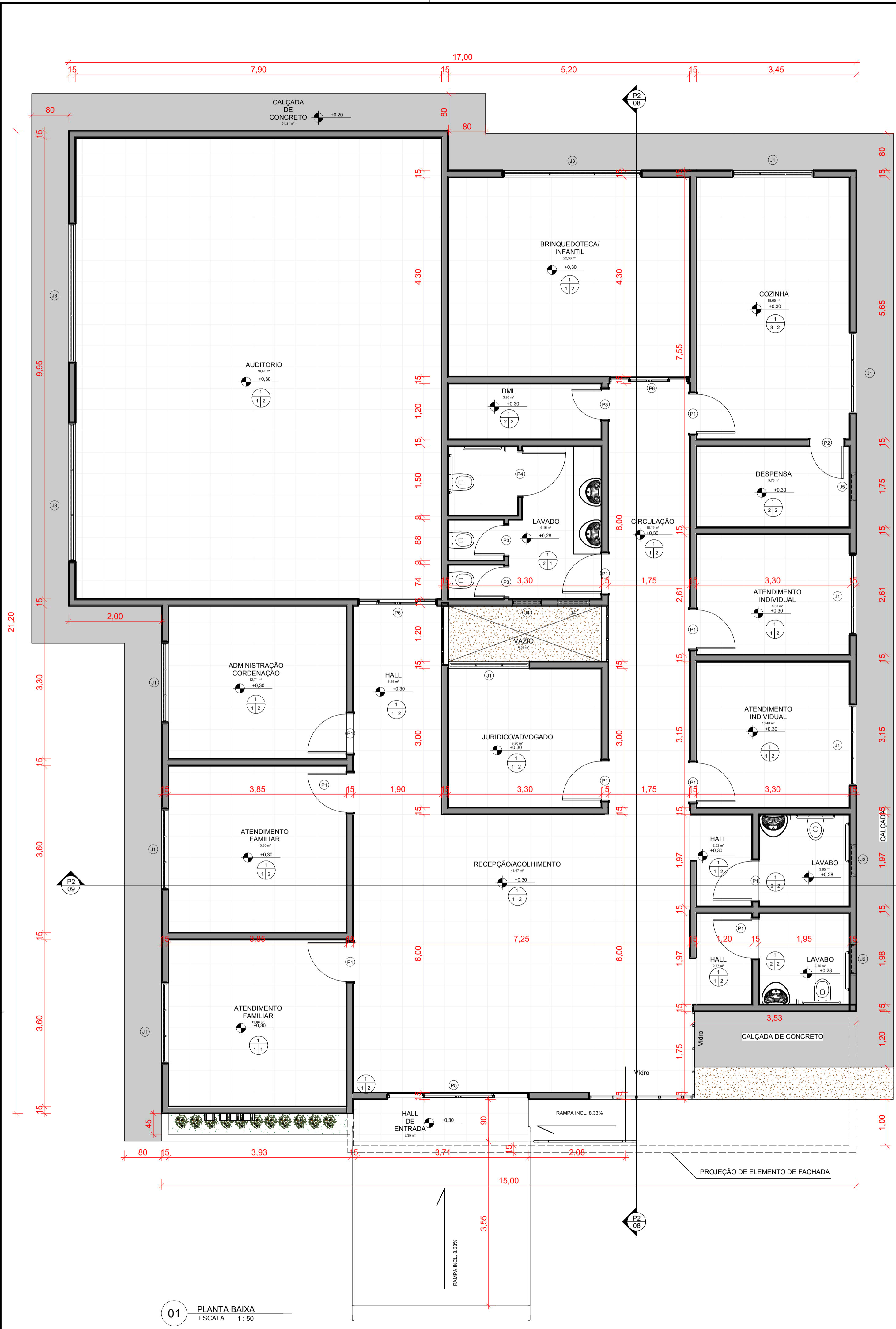
01 PLANTA BAIXA ESCALA 1:50